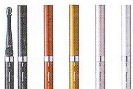
携帯用電動ハブラシ